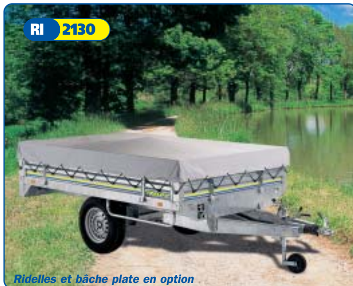
Ridelles et bâche plate en option