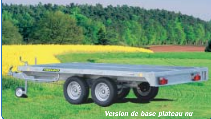
Version de base plateau nu