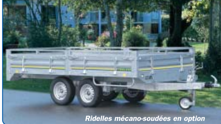
Ridelles mécano-soudées en option

Ridelles mécano-soudées et réhausses grillagées en option