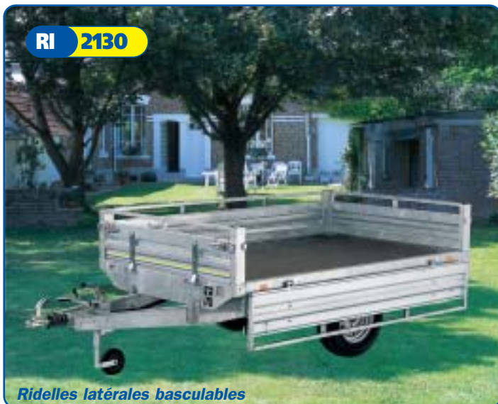
Ridelles latérales basculables