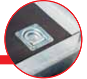
4 anneaux d'arrimage encastrés dans le plancher