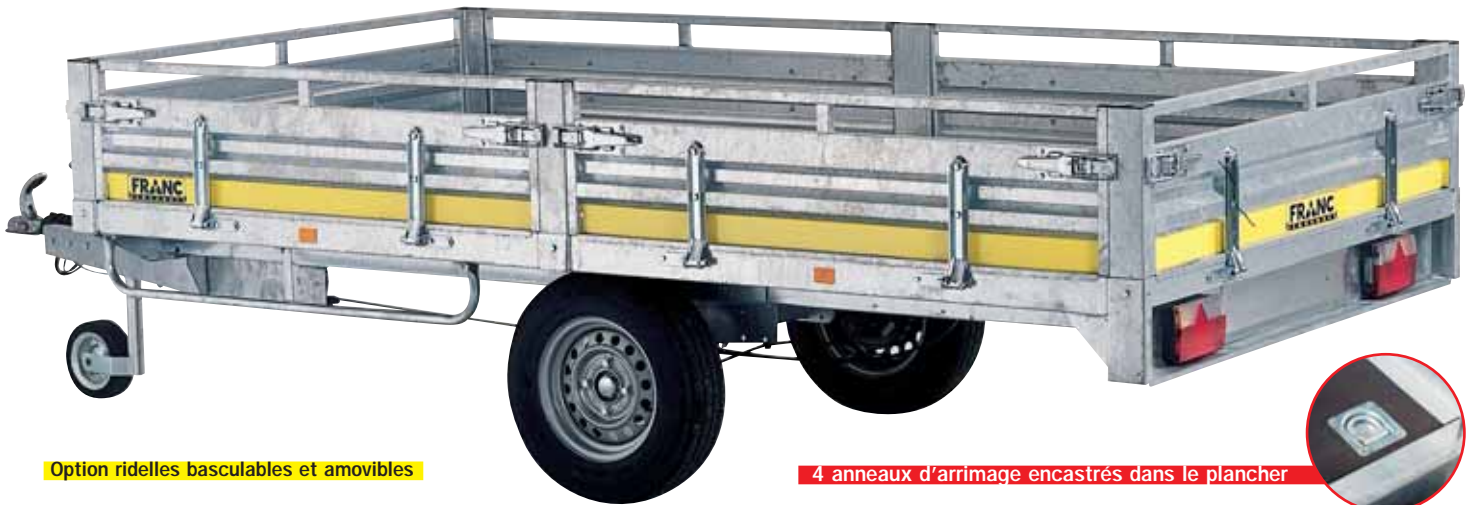
Option ridelles basculables et amovibles