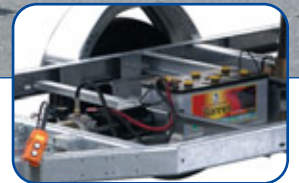
Batterie en option