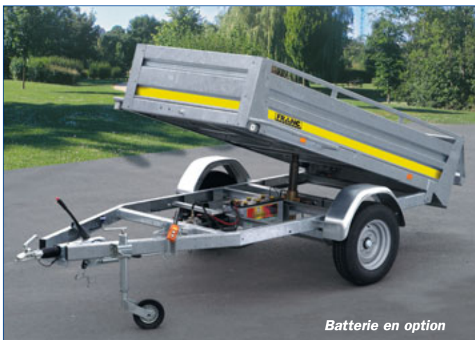
Batterie en option

Nombreux accessoires disponibles en option