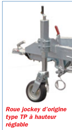
Roue jockey d'origine type TP à hauteur réglable