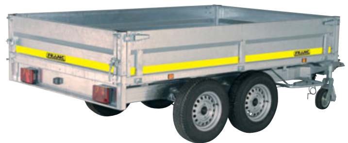
Nombreux accessoires disponibles en option